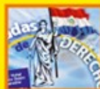
Segundo Módulo de las Jornadas de Derecho Judicial