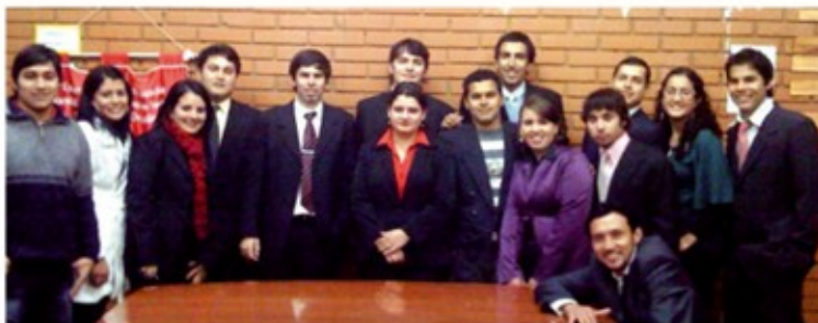
Actual Mesa Directiva del Centro de Estudiantes.