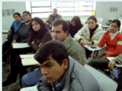
Con gran interés se desarrollaron las disertaciones.

En el plano académico, abordaron la necesidad de exigir la didáctica universitaria a los catedráticos, “los profesores que estudiaron la constitución de 1967 se pierden al momento de enseñar la establecida desde el año 1992, porque se siguen rigiendo por las leyes anteriores. Debe ser una exigencia la didáctica universitaria”, requirieron.