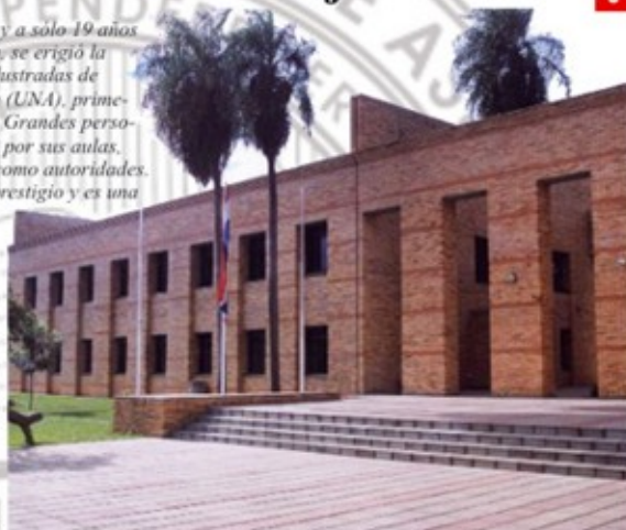
Sede central de la Facultad de Derecho, una de las primeras carreras creadas

Con la Constitución Nacional de 1992, fue redactado y aprobado el Estatuto Universitario, ley que ayuda a garantizar cierta autonomía a la Universidad. Hoy en día las Universidades concentran a sus líderes entorno a los Centros de Estudiantes, comisión encargada de velar por el bienestar