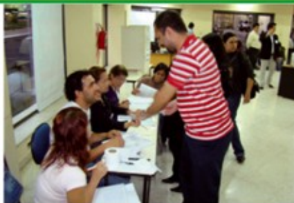
Un alumno se presenta a la mesa para depositar su voto.

“Primeramente a mí no me atrajo mucho la idea, no me resultaba interesante, pero con el correr del tiempo fueron afianzando este proyecto, y en el debate fue cuando me convenció la manera seria en que se desarrolló todo. Elegí a mi candidato y voté. Ojalá que ahora sigan trabajando con el mismo esmero”.