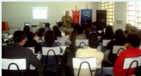
Los estudiantes prácticamente llenaron el salón en San Juan Bautista.