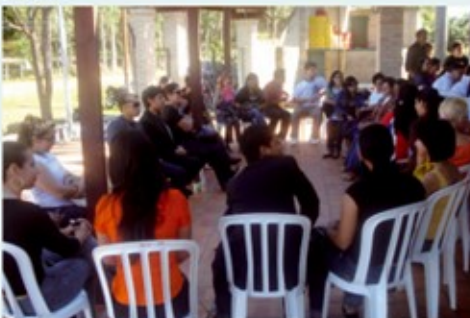
Los jóvenes formaron grupos en una parte de la didáctica.

Los participantes aseguraron que uno de los condicionantes en el actual sistema de justicia es el miedo a represalias, la fama de corruptos con que gozan los operadores de justicia y la falta de métodos de resolución de conflictos colectivos en el sistema judicial. La carencia de materiales y recursos económicos es otro factor preponderante a la hora de impartir justicia.