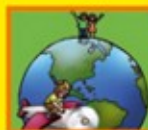
Guía Jurídica Básica: "Trámites para obtener permiso del menor"