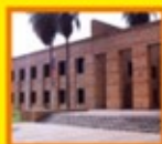
120 años de la Universidad Nacional