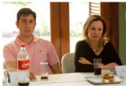
Estudiantes de Misiones durante la reunión.