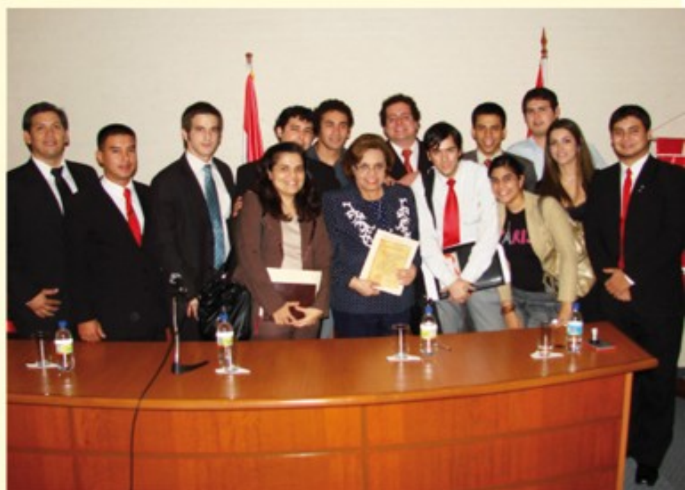
Estudiantes manifestaron su satisfacción tras la firma del convenio. Aquí, con la intendenta Evanhy de Gallegos.