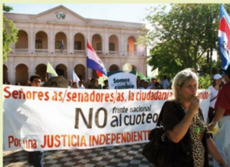
Sectores organizados de la sociedad civil en una de las manifestaciones ante las autoridades.

En una publicación de enero de 2009, el diario La Nación afirmaba que "el cuoteo político es absolutamente inevitable en la cuestión judicial por imperio del mayor error cometido en la Constitución. Las formas de elegir impuestas por la Carta Magna, a causa del sistema electoral de representación proporcional, hacen imposible que se pueda llenar los