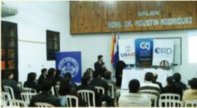
Tanto estudiantes como profesionales del Derecho asistieron al Conversatorio en Villarrica.