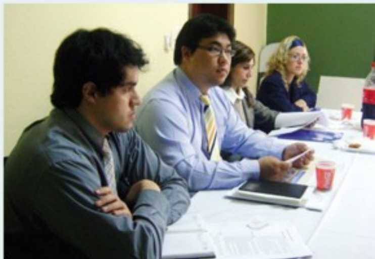
Líderes estudiantiles participaron en la elaboración del estatuto.