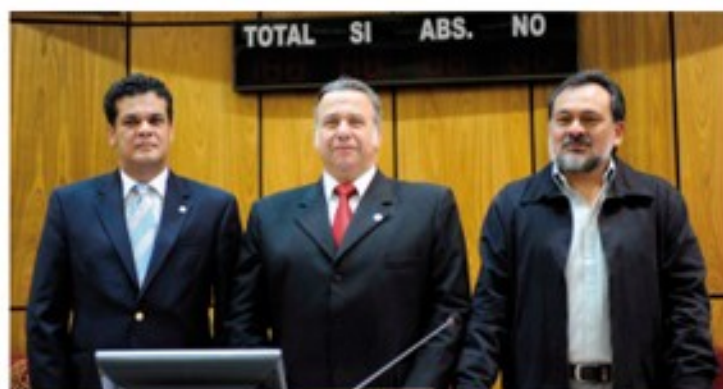
Nueva Mesa Directiva del Senado.

Para la elección de González Daher, los senadores