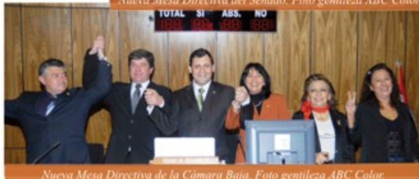
Nueva Mesa Directiva de la Cámara Baja.