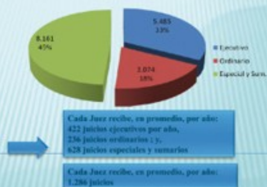
CIRCUNSCRIPCIÓN JUDICIAL CAPITAL JUZGADOS DE PRIMERA INSTANCIA EN LO CIVIL Y COMERCIAL DE ASUNCIÓN DISTRIBUCIÓN DE CASOS CIVILES POR TIPOS DE JUICIOS. AÑO 2009

y ordena mandamiento de pago, previa verificación de la validez de los documentos probatorios que confirman la pretensión. En caso que el demandado se oponga al mandamiento de pago, el procedimiento se transforma en ordinario (Uruguay) o requiere una audiencia pública (Costa Rica).