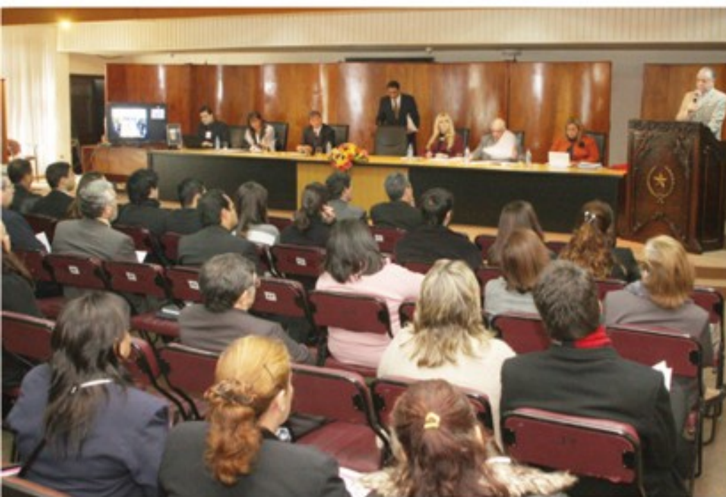
La iniciativa de la CSJ tuvo gran convocatoria.

La encargada de Recursos Humanos acotó en este sentido