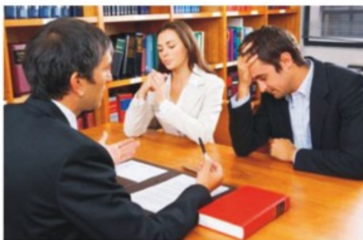
El proceso actualmente dura 30 días.

Los casos de divorcio por mutuo acuerdo y juicios de disolución de la sociedad conyugal que se tramitan en conjunto con el divorcio vincular, implementan desde finales del año pasado un novedoso sistema que ataca en forma directa la mora judicial, uno de los principales problemas del sistema que denuncian los usuarios de justicia. Es que el proceso de divorcio, que antes duraba de 200 a 220 días, actualmente dura 30 días, ya que en una sola audiencia, las partes se ratifican en la decisión y se dicta la sentencia definitiva.