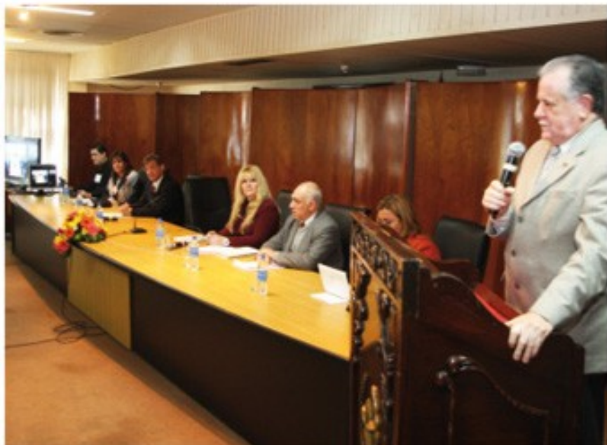
El ministro Núñez durante la apertura de la reunión.

El sistema de pasantías universitarias, tanto en el área jurídica como en otras ramas profesionales, fue el tema que causó mayor resonancia el pasado 14 de julio, durante el Conversatorio realizado por la Corte Suprema de Justicia (CSJ), en el que estuvieron presentes además de ciudadanos interesados, miembros de organizaciones de la sociedad civil, funcionarios, autoridades de instituciones educativas, entre otras. Directores de áreas administrativas y de gestión del Poder Judicial expusieron puntos básicos del manejo de sus respectivas funciones y respondieron a las preguntas de los presentes.