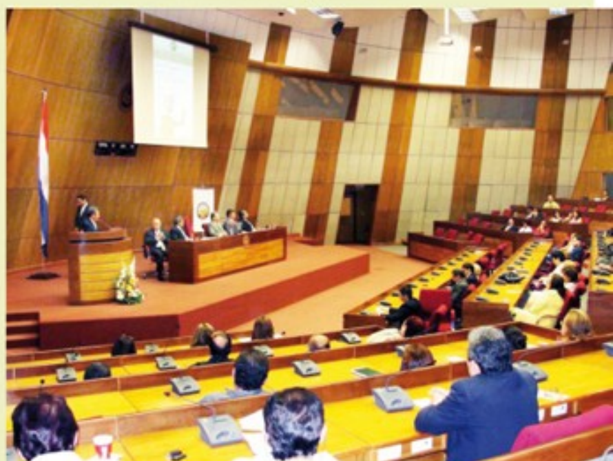
Los partidos políticos juegan un papel decisivo en la designación en cargos públicos.