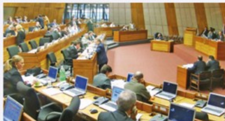
El proyecto quedó sin tratarse en Diputados

Más informes en http://mesaempleojuvenil.org