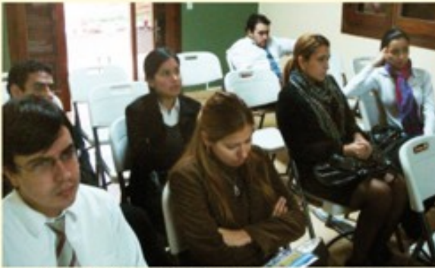
La campaña se inició el 9 de julio, con el conversatorio realizado en el local del CEJ.

Mora, en el local del CEJ, quienes debatieron sobre temas actuales del sistema judicial, el ejercicio de la abogacía y los avances en el mejoramiento de la justicia civil.