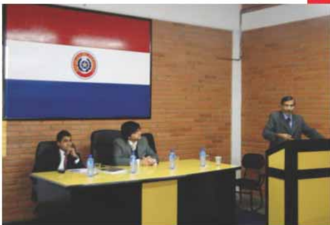
Expositores en la UCA de Villarrica.