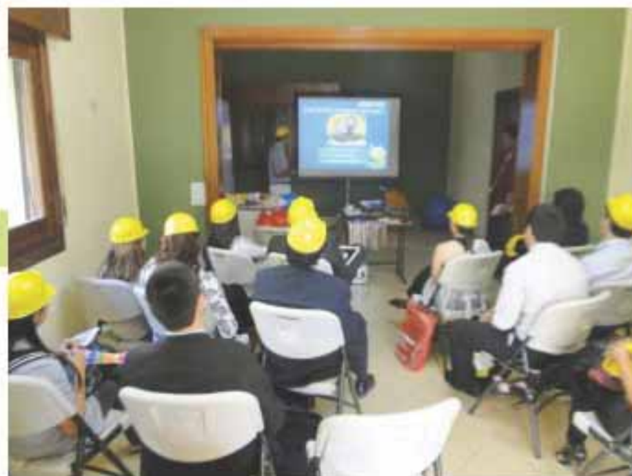
El taller se realizó de manera interactiva.

De esta manera, los jóvenes universitarios asumieron el compromiso de construir ciudadanía desde el rol de promotores de los derechos de la infancia, con lo cual resulta necesario este tipo de iniciativas para que adquieran conocimientos y destrezas para, posteriormente, transmitir a niños y niñas cuáles son sus derechos.