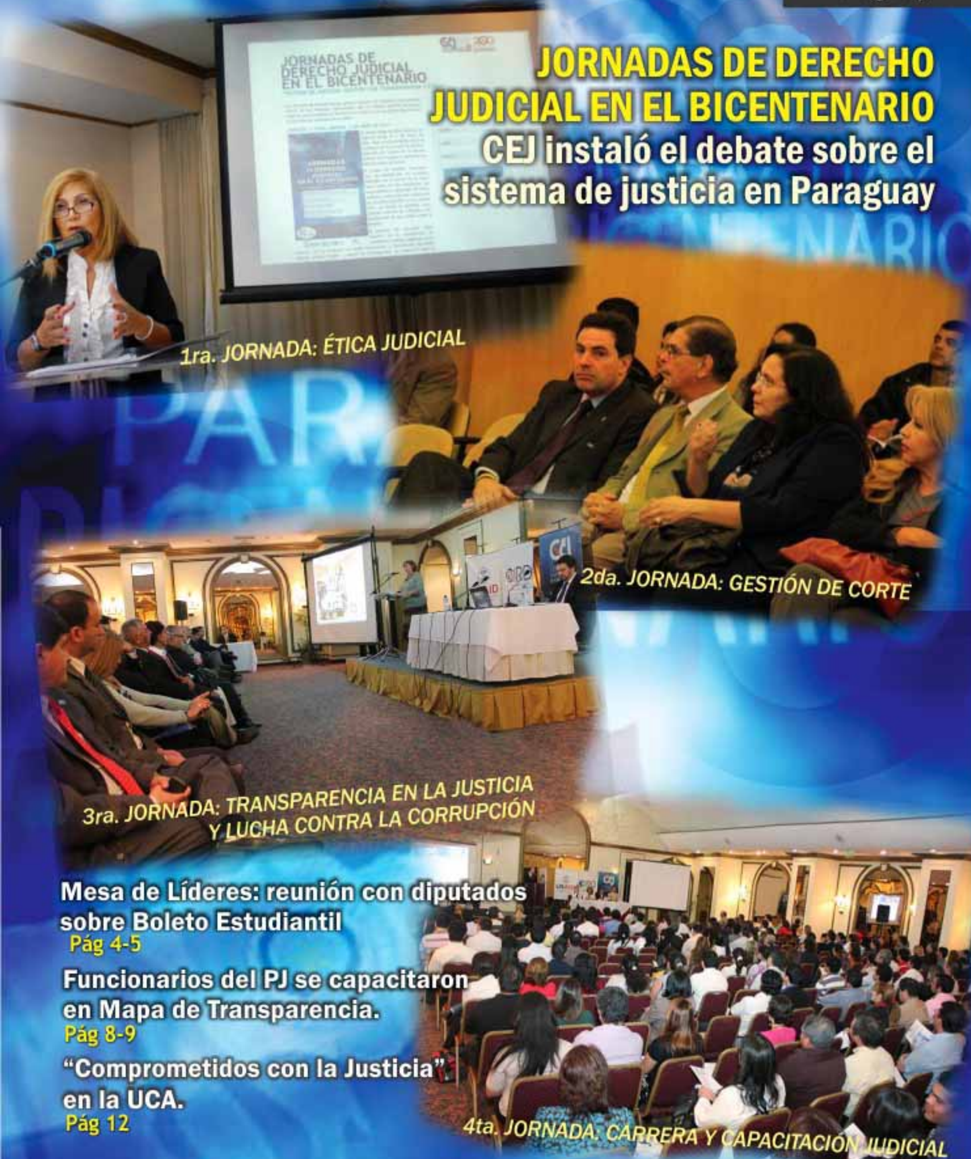
1ra. JORNADA: ÉTICA JUDICIAL