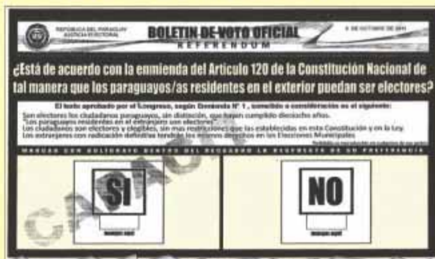
Modelo de boletín a ser utilizado.

Teniendo en cuenta la cantidad de electores y las estimaciones de muy baja participación (entre el 25 a 30%), el Tribunal Superior sugirió habilitar 600 electores por mesa, ya que no entorpecerá el normal desarrollo del acto electoral. Con el mencionado número de habilitados, y si es que se mantienen los 200 electores por mesa, como establece el Código Electoral, los partidos políticos necesitarán de 15.155