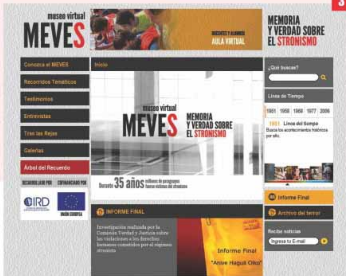
Portada del nuevo portal Web

Los responsables de la iniciativa señalaron que la juventud en su gran mayoría conoce poco de la historia reciente del país, específicamente lo relacionado con la dictadura de Stroessner, por ello que el proyecto busca recrear de forma accesible e ilustrativa todos los sucesos de este periodo.