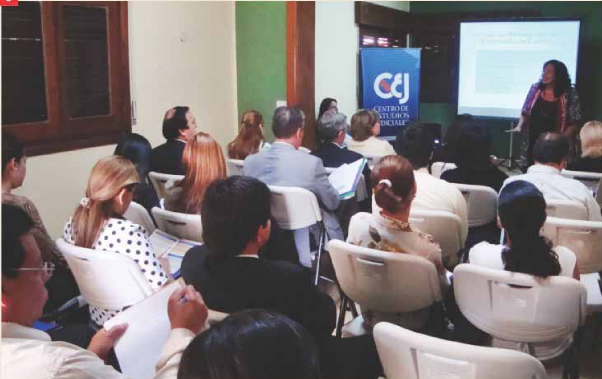
Las capacitaciones se realizará en un periodo de cuatro meses.

Para contribuir a la calidad de vida y el desarrollo humano, el área de Participación Ciudadana y Resolución Alternativa de Conflictos, del Centro de Estudios Judiciales, impulsa un Programa de Formación de Mediadores que tiene como objetivo promover la aplicación de la mediación para contribuir al mejoramiento del modo de gestión de los conflictos hacia una cultura de paz social y democracia. El mismo se inició el 16 de agosto y culmina en octubre del 2011.