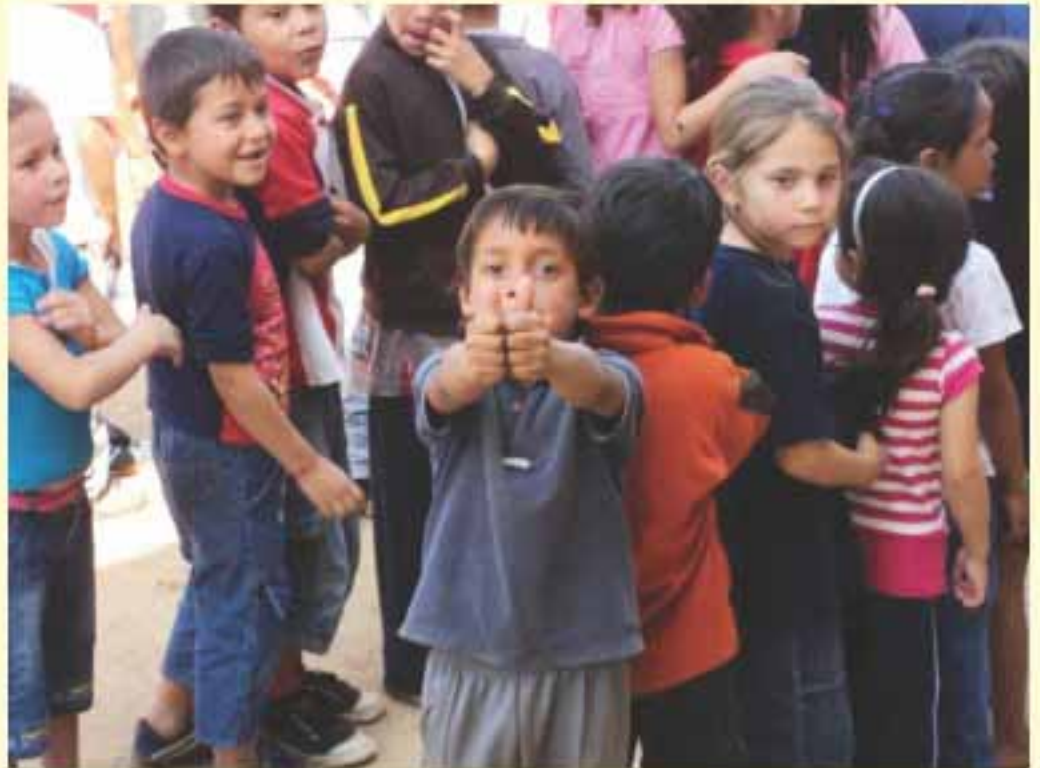
La actividad se desarrolló con niños en situación de pobreza del Bañado Norte.

En este sentido, en el marco del Mes de la Infancia – CEJ 2011, además de la Jornada con los niños y niñas del Bañado Norte, ya se realizó la capacitación a