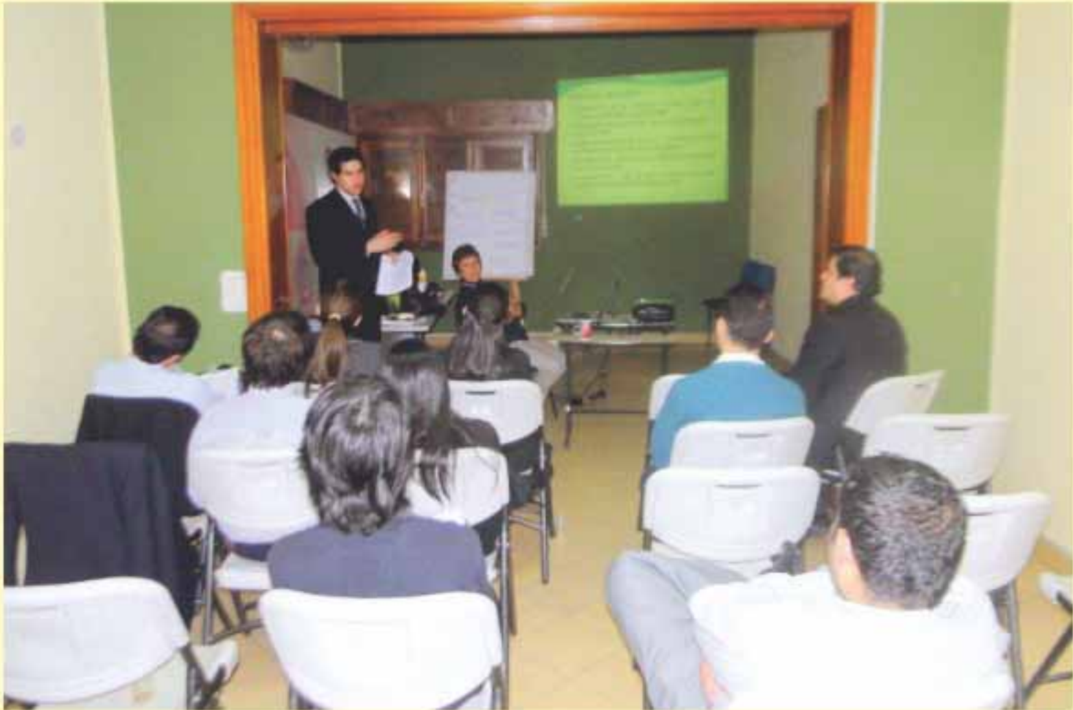
La capacitación se realizó en el local del CEJ.

liderazgos que propicien la continuidad institucional y extensión del proceso del mapa de Transparencia.