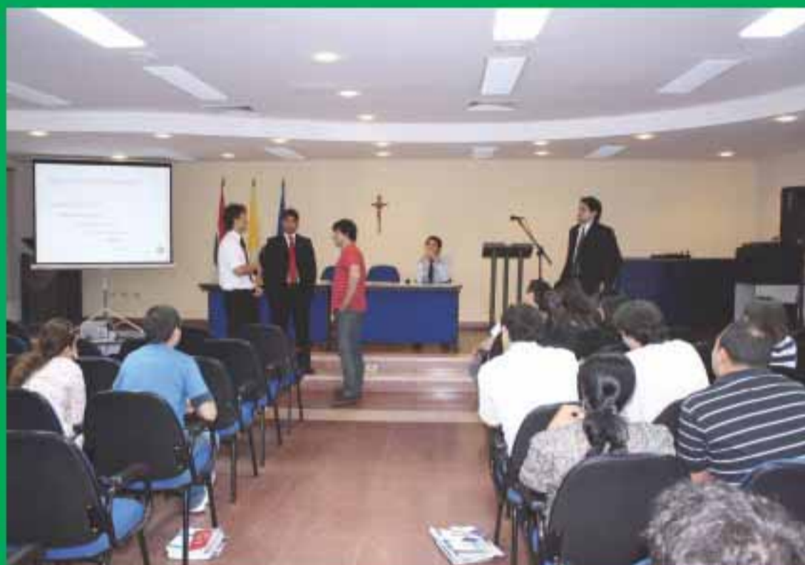
Los estudiantes de la UCA participaron de una interesante didáctica.

El seminario "Comprometidos con la Justicia" se llevó a cabo el pasado jueves 11 de agosto en el Aula Magna de la Universidad Católica Nuestra Señora de la Asunción, con la presencia de estudiantes de derecho que se mostraron interesados en los temas expuestos. La iniciativa es organizada por el Centro de Estudios Judiciales, en el marco del programa Estado de Derecho (CEJ, CIRD, USAID), conjuntamente con los Centros de Estudiantes de derecho de universidades públicas y privadas.