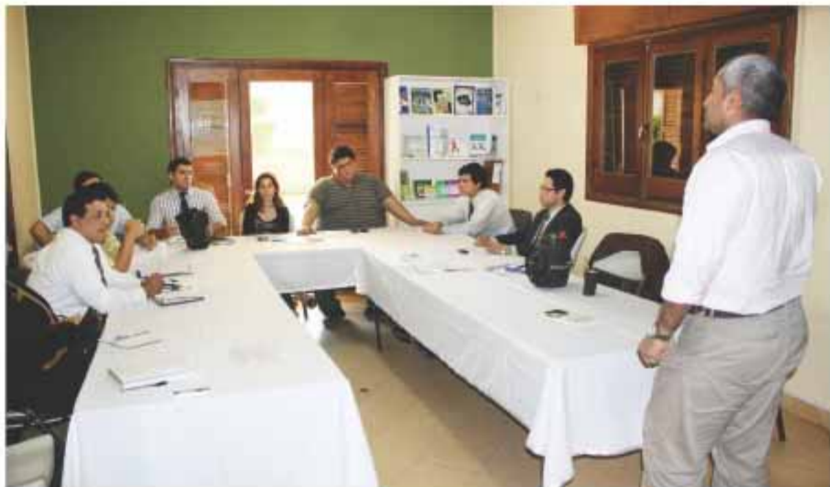
Los estudiantes aprendieron estrategias sobre Marketing Político.