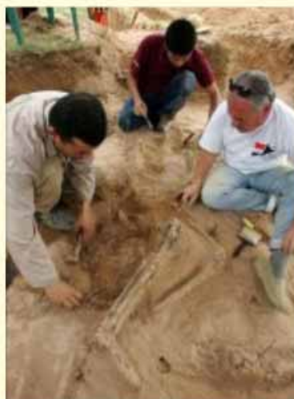
Trabajos de búsqueda de desaparecidos que realiza la Dirección General de Verdad y Justicia. La Agrupación Especializada de la Policía Nacional, funcionó como centro de reclusión durante la dictadura.

La Comisión solicitó que la Corte declare que el Estado es responsable por la violación continuada del artículo 5 (Derecho a la Integridad Personal) de la Convención Americana, en relación con el artículo 1.1 de la misma, en perjuicio de los familiares de las víctimas. Asimismo, la Comisión solicitó se declare que el Estado ha violado de manera continuada los artículos 8 (Garantías Judiciales) y 25 (Protección Judicial) de la Convención, en conexión con el artículo 1.1 de la misma, en