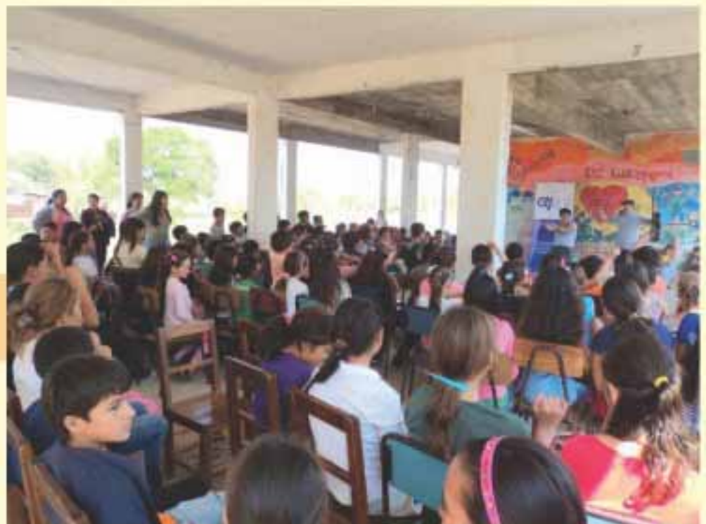
Los alumnos disfrutaron de una jornada llena de música y alegría.

ciudadanos del sector empresarial, social y universitario en el uso del software educativo “La oruga digital”, con el objetivo de que los participantes del taller trabajen luego en la difusión del software educativo con niños de sus respectivas comunidades.