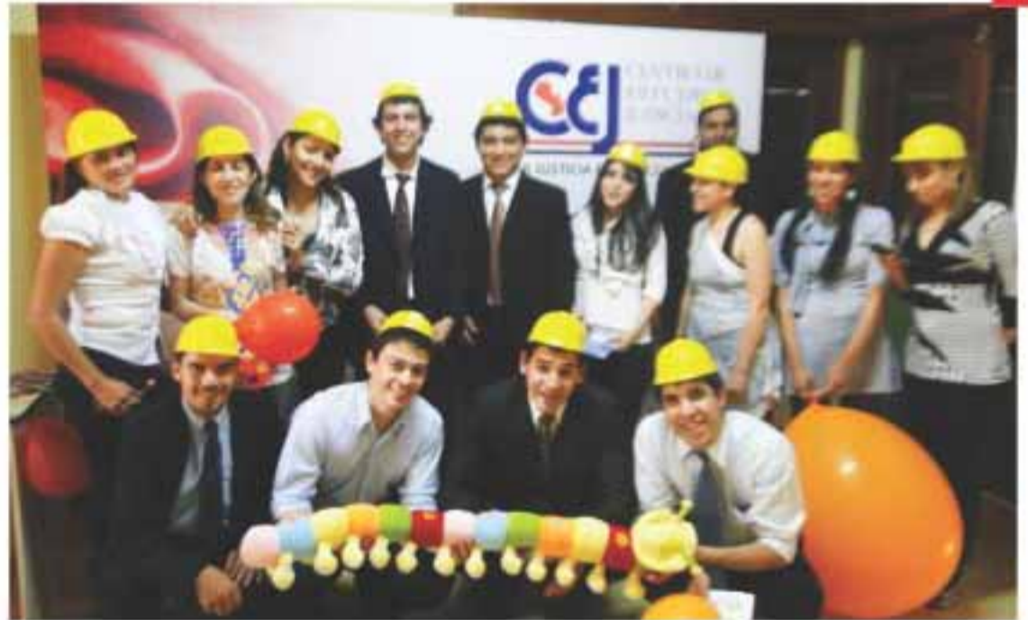
Promotores de los derechos de la infancia. Los jóvenes participaron con entusiasmo de la capacitación.

Jóvenes del sector privado y estudiantes universitarios se unieron a la campaña del Centro de Estudios Judiciales “Por una niñez justa y feliz”, que se llevó a cabo el viernes 12 de agosto del 2011, entrenándose con el objetivo de llevar a sus comunidades “El Juego de la Oruga”, un software didáctico sobre los derechos de la infancia que acerca a niños y niñas al conocimiento del Poder Judicial.