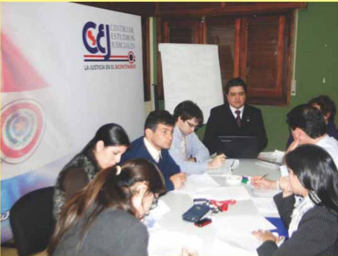
Los talleres se desarrollaron en grupos de ocho funcionarios.

El Centro de Estudios Judiciales inició la capacitación y actualización sobre el "Mapa de Transparencia del Poder Judicial" a funcionarios de la Dirección de Asuntos Internacionales e Integridad institucional, con el objetivo de institucionalizar un proceso que fortalecerá la integridad y la transparencia judicial. El mismo se desarrolló durante la segunda quincena del mes de julio, en el marco del programa de Fortalecimiento del Estado de Derecho (CEJ, CIRD, USAID).